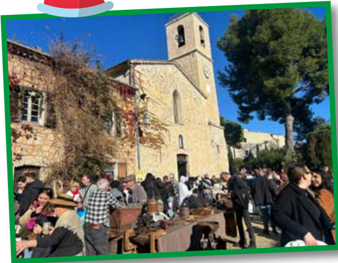
Les métiers d'Antan lors du Marché de Noël du 1 er décembre.