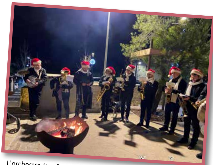
L'orchestre Jazz Band Le Cannet pour l'animation musicale autour de braseros.