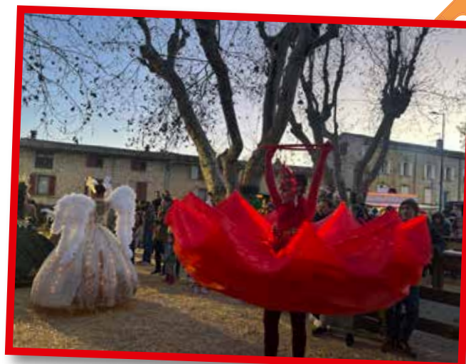
Déambulations lors de la soirée "J'aime Noël", le samedi 21 décembre dernier.