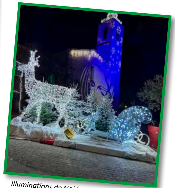
Illuminations de Noël sur la façade de l'église.