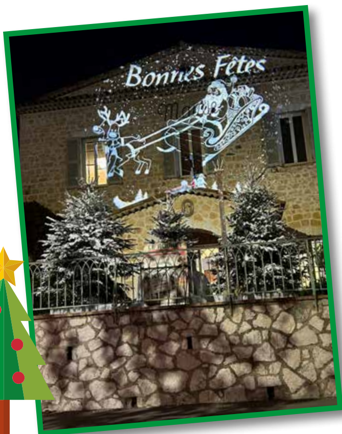
Illuminations de Noël sur la façade de la Mairie.