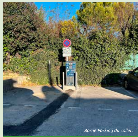
Borne Parking du collet.

Les bornes WiiiZ sont désormais présentes dans 70 communes de l'ouest des Alpes-Maritimes, facilitant la recharge des véhicules électriques, de plus en plus nombreux sur le territoire. Au Rouret, deux sites équipés de 2 prises chacun vous attendent . Mais pour encore plus de praticité, des bornes supplémentaires sont désormais accessibles à proximité, notamment à Châteauneuf-Grasse (11, Chemin du Cabanon et Place des Pins) et à Opio (1 ter, Route de Grasse, 7, Route de Nice et au Rond-Point de la Fontaine).