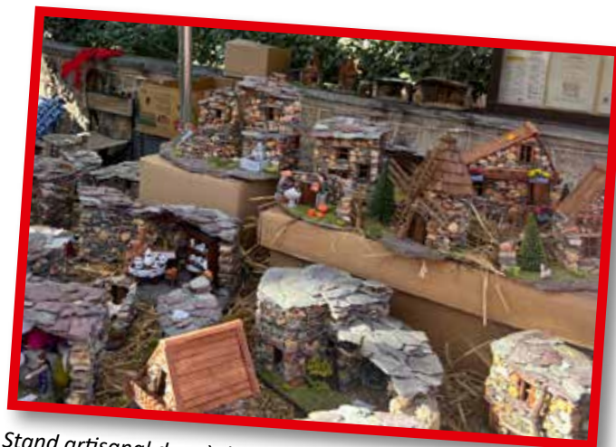
Stand artisanal de crèche en pierre présent au Marché de Noël du 1 er décembre.

Enfin, la messe de Noël du 24 décembre a religieusement clôturé ces festivités, inscrivant Le Rouret comme un lieu phare des fêtes de fin d'année .