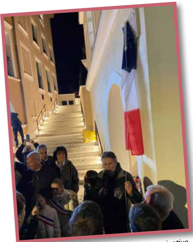
Dévoilement de la traditionnelle plaque nominative de la traverse Époux Garnerone.

Rétrospective sur l'inauguration de ce chantier, le 5 décembre dernier.