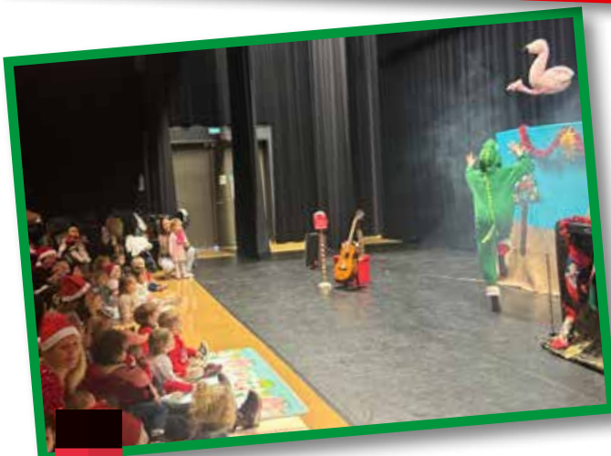
Spectacle de Noël de la crèche et de l'association des assistantes maternelles. Noël du Ptit croco par Duo Liberi