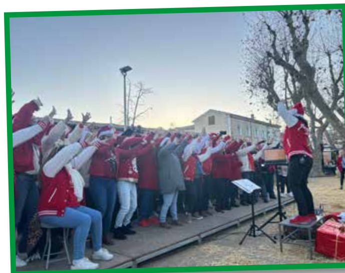
Chorale "Cœur du Sud".